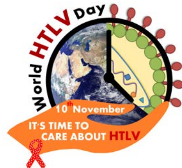
IRVA - Associação Internacional de Retrovirologia Site: https://htlv.net/