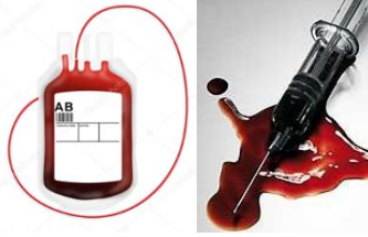
Parenteral - transfusão de sangue e compartilhamento de seringas ou perfurocortantes infectados.