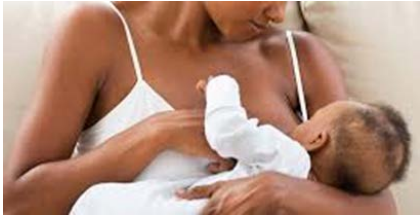
Vertical - da mãe para o filho, principalmente durante a amamentação.