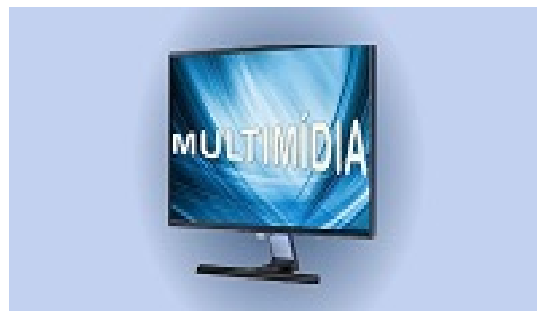
Mídias em diversos temas de saúde